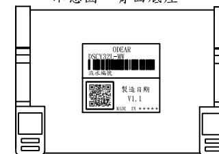
示意圖 - 背面底座