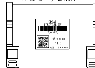
示意圖 - 背面底座