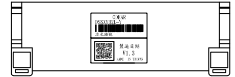
示意圖 - 背面底座