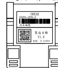
示意圖 - 背面底座